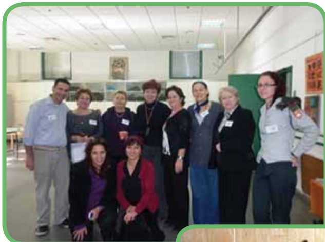
תמונה 11: "תמונת מחזור" - כנס הכימיה לתלמידים - מחוז דרום 2011, המארגנים והמורים, ברגע של קורת רוח וגאוות יחידה משותפת.

תיכון "כרמל", תיכון "לאו-בק", ביה"ס "הריאלי" - חיפה, "אורט רונסון" עוספייה, תיכון "שיפמן" - טירת הכרמל, תיכון "אלבטוף" - כפר עוזיר, תיכון כפר-כנא, רוגוזין - קרית אתא, "כרמל זבולין" - יגור.