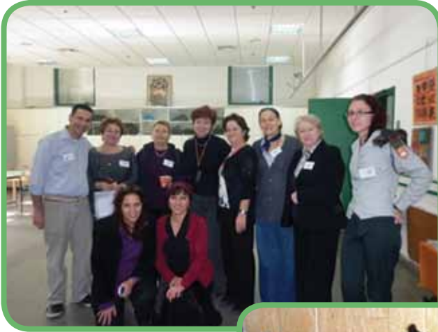
תמונה 11: "תמונת מחזור" - כנס הכימיה לתלמידים - מחוז דרום 2011, המארגנים והמורים, ברגע של קורת רוח וגאוות יחידה משותפת.

תיכון "כרמל", תיכון "לאו-בק", ביה"ס "הריאלי" - חיפה, "אורט רונסון" עוספייה, תיכון "שיפמן" - טירת הכרמל, תיכון "אלבטוף" - כפר עוזיר, תיכון כפר-כנא, רוגוזין - קרית אתא, "כרמל זבולון" - יגור.