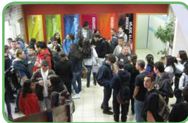
תמונה 2: "הילדים באים" - אחד הרגעים המרגשים בכנס, הוא המולת ההגעה של הקבוצות השונות, חלוקת תגי השם, תדריך למורים - איך עומד היום להתנהל.

התלמידים הרצאות מוזמנות מפי מומחים בנושאים מחזית המדע, ואילו המושב השני יתנהל במתכונת של מושבים מקבילים ויועבר על ידי התלמידים. החלטנו מראש להותיר מקום לשינויי תכנית מקומיים בהתאם ליצירתיות ולכושר הארגון של המארגנים המקומיים.