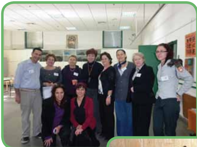
תמונה 11: "תמונת מחזור" - כנס הכימיה לתלמידים - מחוז דרום 2011, המארגנים והמורים, ברגע של קורת רוח וגאוות יחידה משותפת.

תיכון "כרמל", תיכון "לאו-בק", ביה"ס "הריאלי" - חיפה, "אורט רונסון" עוספייה, תיכון "שיפמן" - טירת הכרמל, תיכון "אלבטוף" - כפר עוזיר, תיכון כפר-כנא, רוגוזין - קרית אתא, "כרמל זבולון" - יגור.