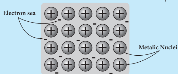
מודל סטטי למבנה המתכת

2. בְּחַרוּ בְּאֶחָד מֵהָאִיוֹרִים וְצִיְנוּ מַה נִּסְמָן כֹּל פֶּרֶט בְּאִיוֹר, אֵהֵן אֶחָד מֵהַמּוֹדֵלִים שֶׁהוֹצֵגוּ.