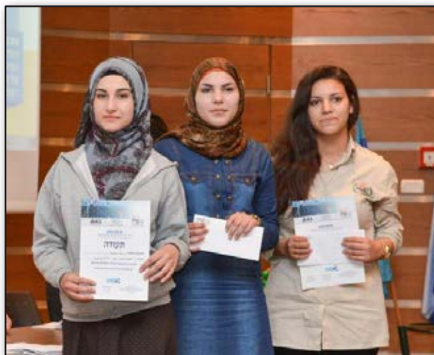
מקום שלישי בתחרות הפוסטרים: "אצות מאירות ומטהרות". מקום שני בתחרות הסרטונים: "קופקסון".

לשלב האקדמי בחיינו... לאוניברסיטה. דבר אחרון הוא רגע ההצלחה... קודם כל הסוד של ההצלחה שלנו הוא הרצון להצליח והרצון לחקור תחום מדעי חדש ומסקרן, ולכן בחרנו בנושא חדש בפרויקט שלנו... משהו שעדיין לא קיים במציאות (באופן מעשי ובפועל)... שיהיה ממש מסקרן לכולם, חקרנו את הנושא (אצות מאירות ומטהרות)... והבטחנו לכולם להמשיך ולחקור עד שיהפוך למציאות קיימת באופן מעשי ובפועל... זכינו בפרס בית ספר מצטיין וגם הקבוצה שלנו זכתה במקום השלישי בתחרות הכרזות. הרגע הזה הוכיח שאם תרצו אין זו אגדה!"