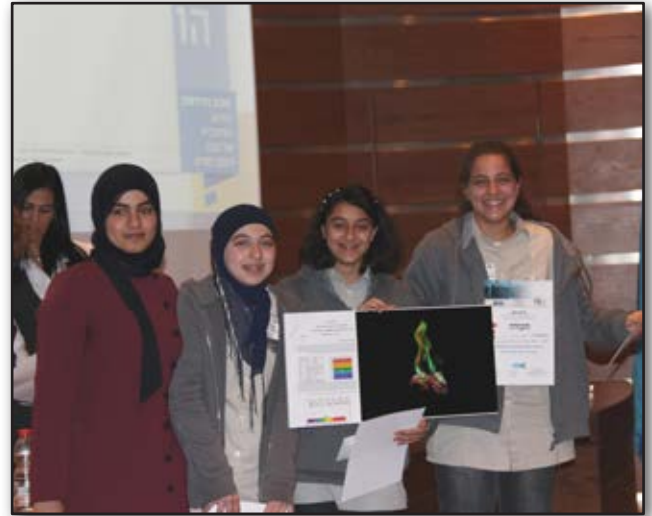
מקום ראשון בתחרות התצלומים: "פרח אש". מקום שלישי בתחרות התצלומים: "חיוך מקסים חיוך של כימאים".