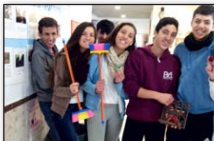
מסיימים בחיוך - במשחק קווידיץ' קבוצתי