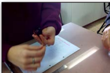
אחת הקבוצות חקרה השפעת נפח תמיסת PVA על היקף הכדור