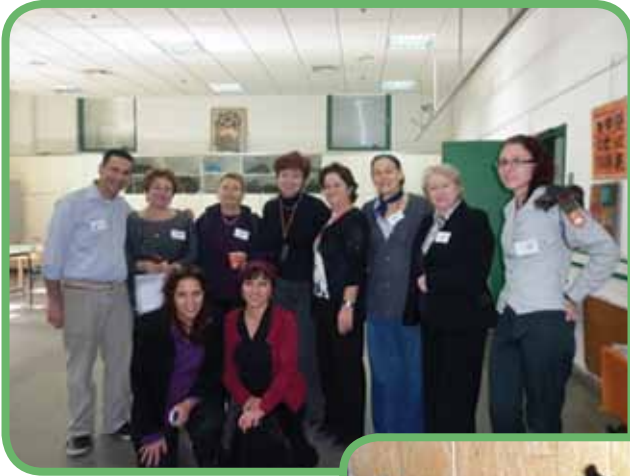
תמונה 11: "תמונת מחזור" - כנס הכימיה לתלמידים - מחוז דרום 2011, המארגנים והמורים, ברגע של קורת רוח וגאוות יחידה משותפת.

תיכון "כרמל", תיכון "לאו-בק", ביה"ס "הריאלי" - חיפה, "אורט רונסון" עוספייה, תיכון "שיפמן" - טירת הכרמל, תיכון "אלבטוף" - כפר עוזיר, תיכון כפר-כנא, רוגוזין - קרית אתא, "כרמל זבולון" - יגור.